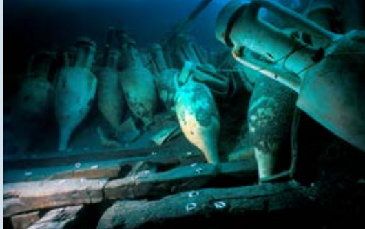
La Madrague de Giens