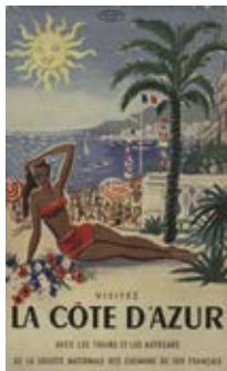
Affiche touristique ancienne