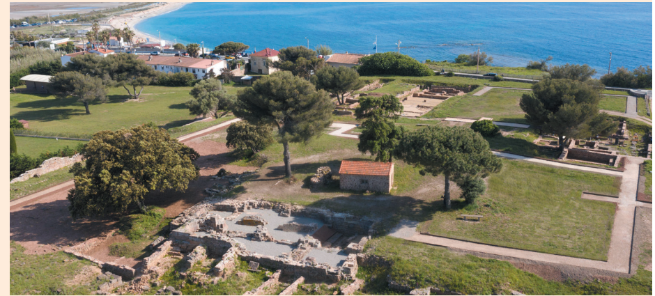
Olbia 2021

Site archéologique d'Olbia — HYERES – L'ALMANARRE