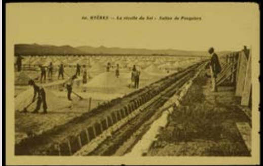
La récolte du sel

notre duo : la voix de Charlotte, guide conférencière, pour découvrir les richesses de cet endroit exceptionnel et la voix de Bénédicte, musicienne au conservatoire et animatrice d'ateliers chants. Venez accorder votre voix aux leurs pour le grand plaisir de chanter ensemble entre mer et maquis.